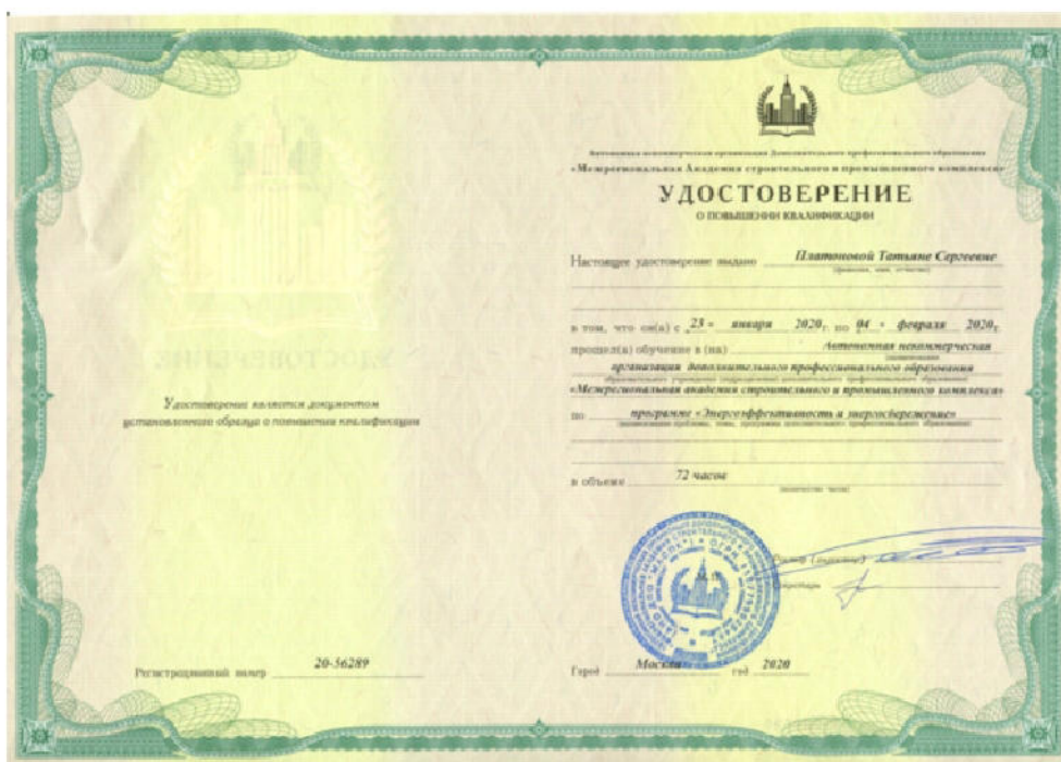
Удостоверение о повышении квалификации специалистов-энергоаудиторов