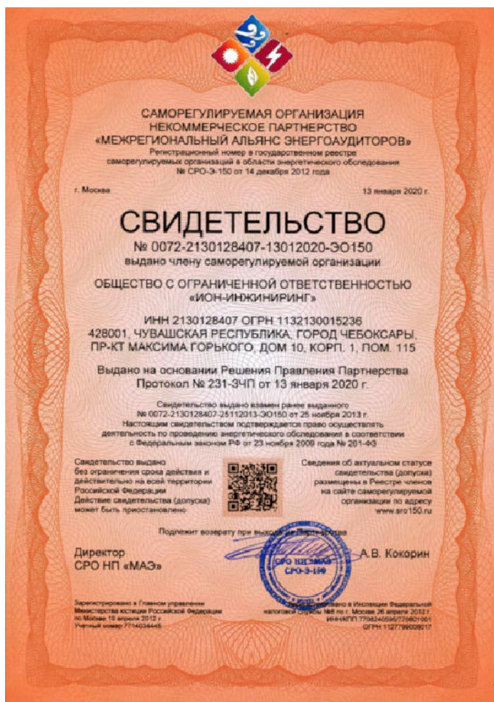
Свидетельство о допуске к работам в области энергетического обследования